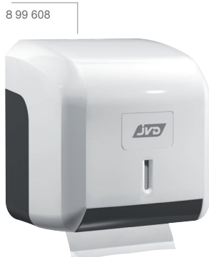
8 99 608