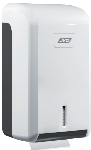
8 99 607